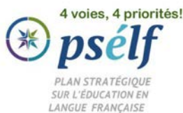
TABLEAU DES ÉTAPES DE LA MISE EN ŒUVRE DU psélf PLAN STRATÉGIQUE SUR L'ÉDUCATION EN LANGUE FRANÇAISE

Dans un premier temps, les membres du Comité tripartite ont assisté à une présentation sur l'état d'avancement des travaux dans le cadre de la mise en œuvre du Plan stratégique sur l'éducation en langue française . Cette mise à jour a été faite à partir du Tableau de monitoring disponible sous l'onglet « contexte » du site Web du PSELF. Comme illustré dans le tableau des étapes de la mise en œuvre du PSELF, l'ensemble des groupes de travail en est à développer des outils de communication pour diffuser les messages clés du PSELF, les indicateurs de pertinence des domaines ainsi que les ressources en appui.