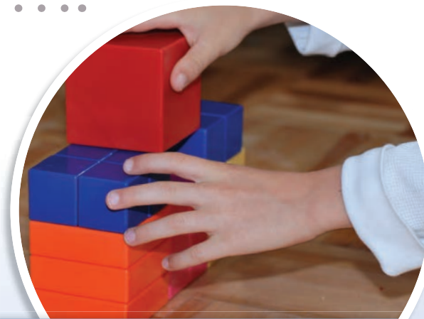
LA CONSTRUCTION IDENTITAIRE