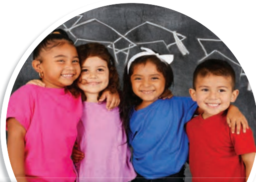
LE CONTINUUM D'ÉTUDES EN LANGUE FRANÇAISE