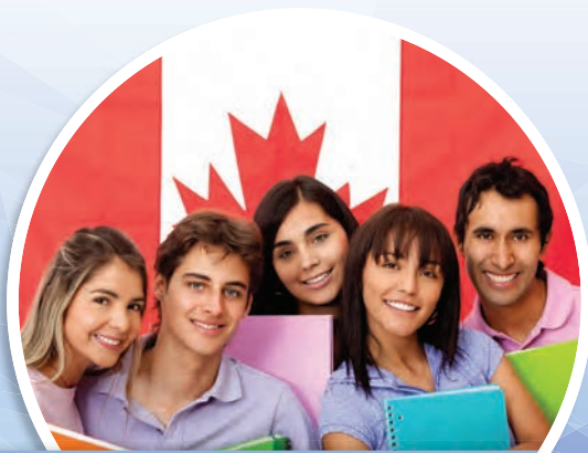
LES COMPÉTENCES LINGUSTIQUES

Le concept de valeur ajoutée sert à reconnaître les avantages de l'école de langue française pour les individus et pour l'ensemble de la communauté.